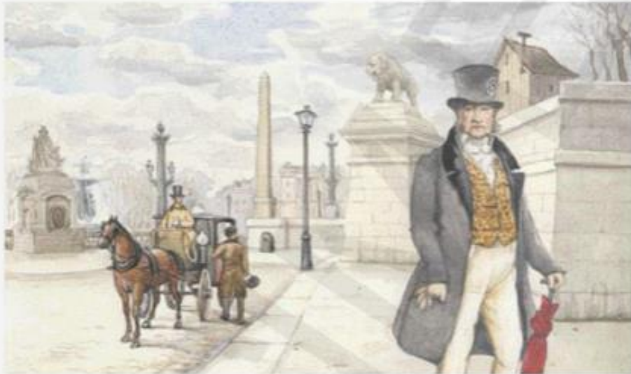
Le roi Louis-Philippe vêtu en simple bourgeois.

La Restauration (1815-1830) — Après la chute de Napoléon, les Français étaient lassés de tant de révolutions et de guerres. Ils restaurèrent (c'est-à-dire rétablirent) la dynastie des Bourbons. C'est la raison pour laquelle on appelle la période de quinze années qui suivit la Restauration. En effet, deux frères de Louis XVI, qui s'étaient réfugiés à l'étranger pendant la Révolution et l'Empire, étaient toujours en vie. Le premier, Louis XVIII, régna de 1815 à 1824 ; le second, Charles X, de 1824 à 1830. Louis XVIII accepta certaines réformes apportées par la Révolution de 1789, mais il était déjà âgé quand il devint roi et il n'eut pas le temps de créer une monarchie constitutionnelle solide. Charles X, lui, voulait carrément revenir à une monarchie autoritaire. Aussi fut-il renversé par la révolution de 1830.