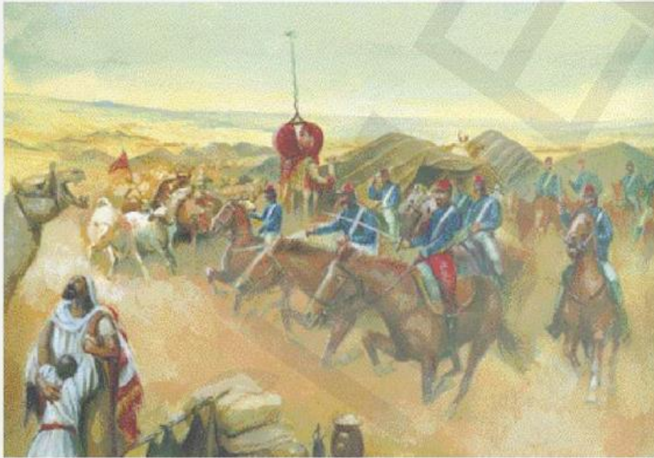
La prise de la smala d'Abd el-Kader (1843).

Un vaste empire colonial — Au début du XIX e siècle, la France perdit presque toutes ses colonies, aux Antilles, au Canada et en Inde, en raison de ses guerres avec l'Angleterre. En outre, Napoléon avait dû vendre la Louisiane aux Américains. Mais sous Charles X, Louis-Philippe puis Napoléon III, la France fit de nouvelles expéditions outre-mer.